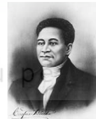
Crispus Attucks más adelante sería el símbolo del abolicionismo

Crispus Attucks, primer afroamericano en ser asesinado en los inicios que llevaría a la independencia de las trece colonias.