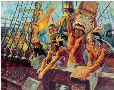
“El Motín del té”, preludeo de la revolución americana.

Líder: Samuel Adams . Disfrazados de indios, patriotas arrojan al mar el cargamento de tres barcos de la compañía: 343 cajas valoradas en 10 000 libras. Consiguiendo su objetivo último, provocar una violenta reacción británica. La respuesta fue las leyes intolerables.