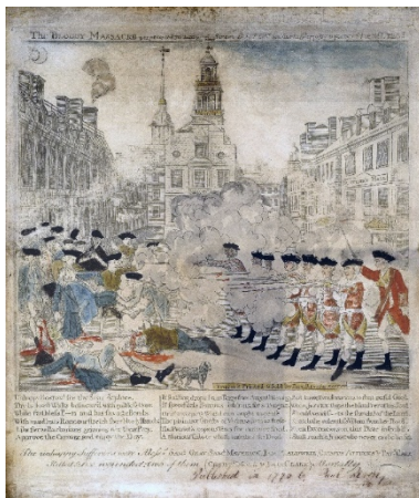
Masacre de Boston

1764 – Sugar Act y el Currency Act 1765 – Stamp Act. 1766 – Inglaterra prohíbe la expansión hacia el oeste. 1767 – Leyes Townshend, del Ministro Charles Townshend, quien haría un reordenamiento colonial, generar ingresos mediante las aduanas. Esto generó un boicot. Resultado del boicot fue que en 1770 se suprimieron todos los derechos aduaneros, excepto, el Tea Act. 2