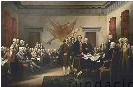
Declaración de la Independencia, Oleo de John Trumbull

Representación idealizada de la redacción de la declaración de la independencia. 4