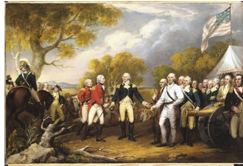
Saratoga (17-X-1777) 5