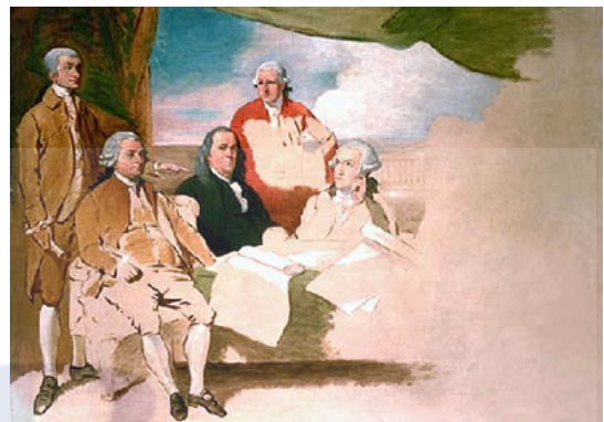
La firma del Tratado de París 7

-Por un lado, había 8.000 británicos al mando de Lord Charles Cornwallis, y por otro, a 9.000 insurgentes americanos, voluntarios de La Fayette, al mando del coronel Armand Tuffin, marqués de la Rouerie, y George Washington, así como 5.000 hombres del cuerpo expedicionario francés del conde Jean Marie Donatien de Vimeur de Rochambeau ( 11.000 franceses en total ). La victoria resultó para el bando estadounidense y la guerra culminó con la rendición sin condiciones de los británicos.