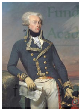
marqués de La Fayette