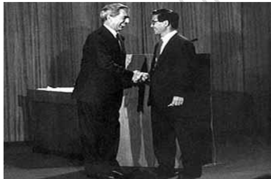
En 1990 la recordada polémica entre Mario Vargas Llosa y Alberto Fujimori incluyó cordial saludo.