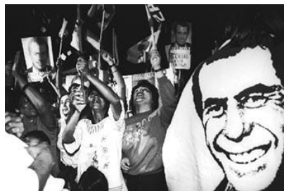
Luego de ser alcalde de Lima, postuló para la presidencia sin fortuna. El lleno de bandera del mitin de Ricardo Belmont fue ignorado por los grandes medios de comunicación.