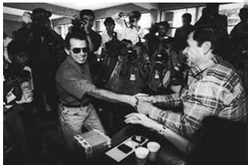
Ricardo Belmont en el momento de votar, la suerte lo acompañó solo en la elección municipal.