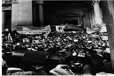
La política de ajuste, generó descontento entre los servidores públicos.