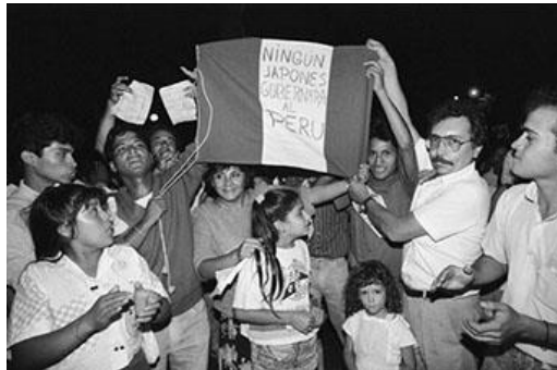
Manifestación racista de ingas y mandingas durante la primera campaña electoral de Alberto Fujimori.