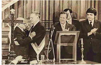
2do Gobierno de FERNANDO BELAUDE TERRY (1980-1985)