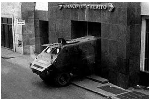
La tanqueta entrando a la fuerza al banco de Crédito del Perú.