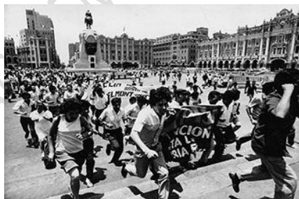
Manifestación en plaza San Martín contra el gobierno municipal de Ricardo Belmont.