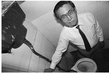
Imagen presidencial. El presidente Alberto Fujimori prueba las instalaciones durante una inspección en el colegio Elvira García y García.