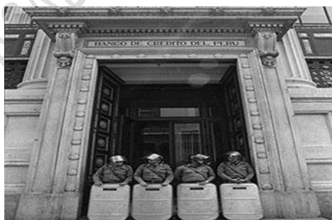
Tras la toma del banco de Crédito y Wiese, la conferencia de los banqueros.

¡A la bruta! Las consecuencias de una imposición inconsulta: la estatización de la banca. Tras despejar violentamente a los periodistas, empezó el asalto final.